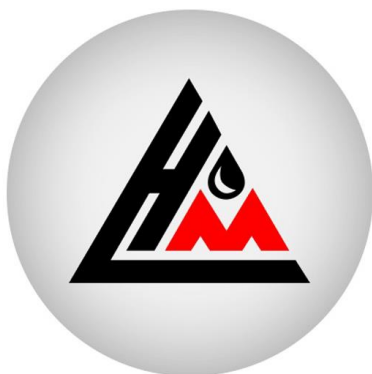
Система лояльности сети Нефть-М