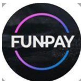
Сервис оплаты лайками FunPay